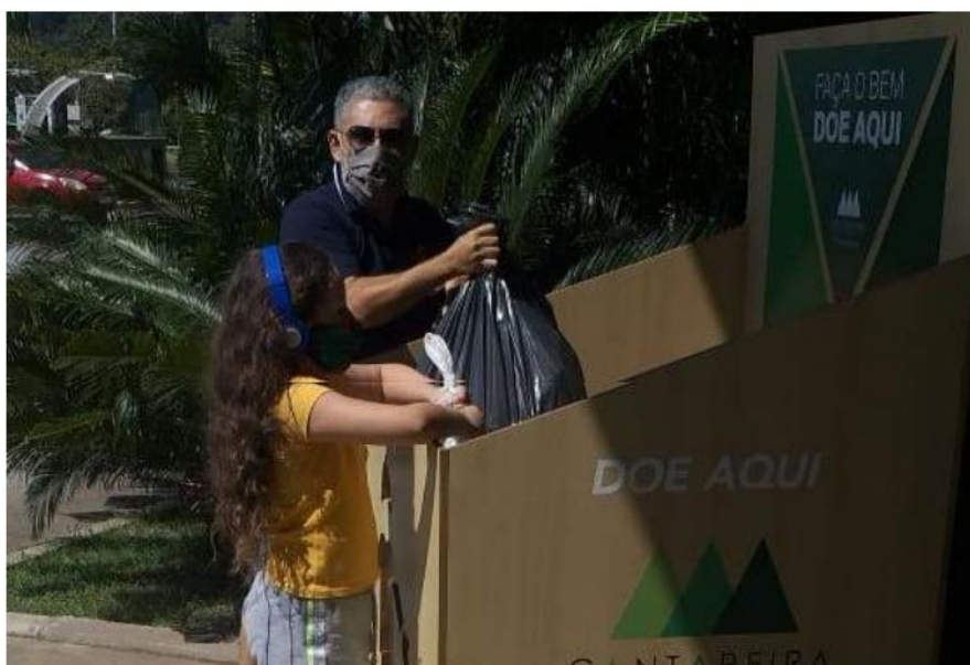
Drive-Thru do Bem do Cantareira Norte Shopping

O Cantareira Norte Shopping, localizado em São Paulo, promove uma campanha de arrecadação de alimentos não perecíveis e itens de vestuários em prol das comunidades carentes da região. As doações podem ser feitas diariamente, das 10h às 19h, por meio de um esquema de drive-thru: uma caixa foi instalada na entrada principal do empreendimento