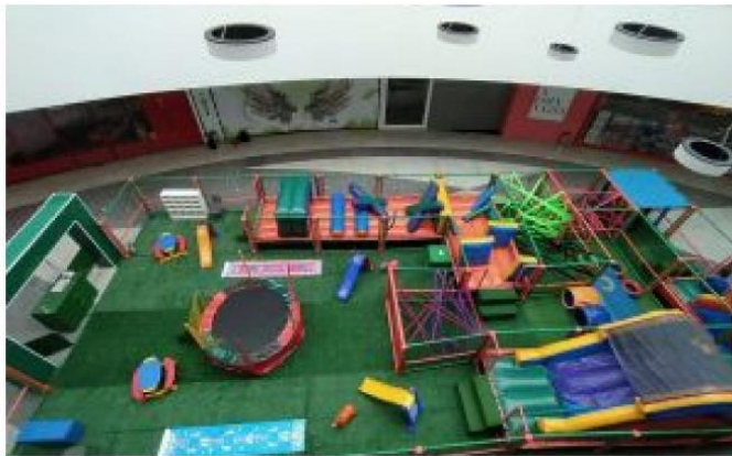
cantareira norte shopping recebe Mundo dos Elásticos

O Cantareira Norte Shopping, localizado na cidade de São Paulo, recebe até o dia 14 de março o Mundo dos Elásticos. O espaço possui uma estrutura com labirintos repletos de elásticos fluorescentes, infláveis, escorregadores, amarelinhas e muitos jogos para os pequenos testarem suas habilidades de maneira divertida.