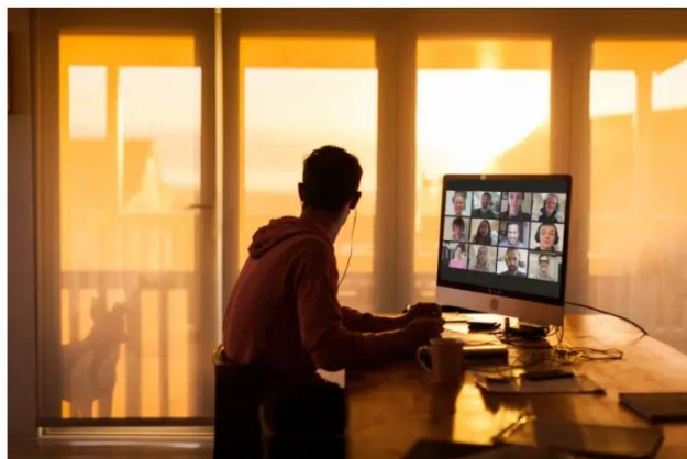
Oportunidade: há dezenas de eventos online gratuitos disponíveis para empreendedores