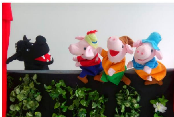
Ação acontece neste sábado (19), às 14h.

Neste sábado (19), às 14h, o Alpha Square Mall (Av. Sagitário 138) segue com as atividades gratuitas do Kids Club e apresenta a peça "Os Três Porquinhos".