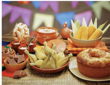
Ação acontece entre quinta-feira, 1º de julho, e domingo (4).