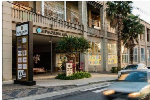
O shopping segue todos os protocolos de segurança no combate à Covid-19.