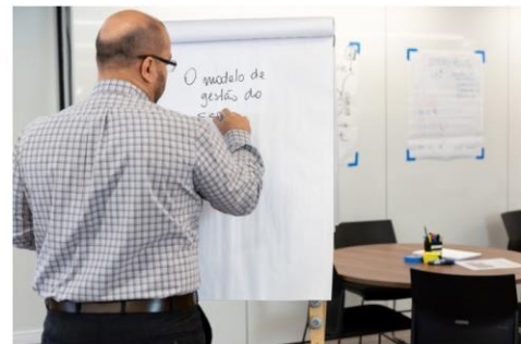
Aloque um Product Owner e delineie um roadmap para se ter um overview geral dos entregáveis e da duração do processo de mudança.