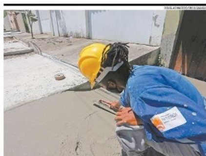
Reparos em Serra Grande e Maravista, entre outros, cumprem metas anunciadas em 2018