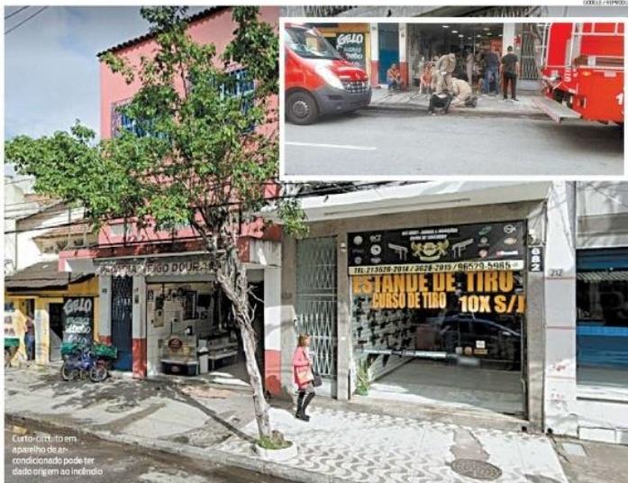
Curto-circuito em aparelho de ar-condicionado pode ter sido origem do incêndio

Um curto-circuito no ar-condicionado do segundo pavimento do estabelecimento é a provável causa do início do fogo. A equipe da Defesa Civil não identificou danos estruturais no prédio, mas hoje os agentes terão uma nova vistoria.